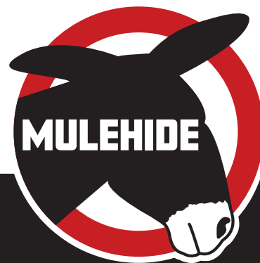
Lámina base de betún modificada por SBS

La elección adecuada para productos de cubiertas de baja pendiente