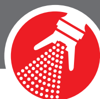
Rociador sin aire